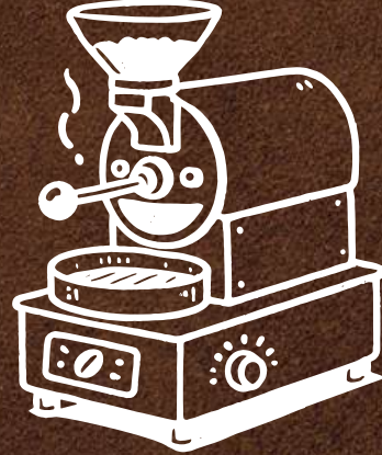
Özel Kavurma Hizmeti