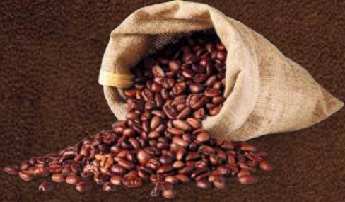
Toptan Kahve Tedariđi