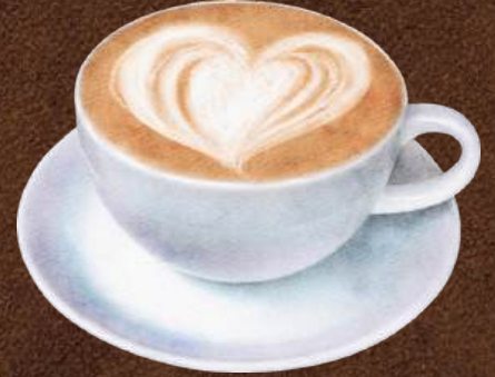
Tadım ve Eđitim Etkinlikleri